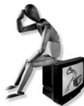
Illustration: Norbert Gräf

Im vierten Zimmer der Zeit _ ISBN 978-3-937550-23-7